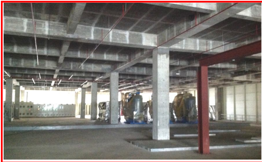
R3 – 2F