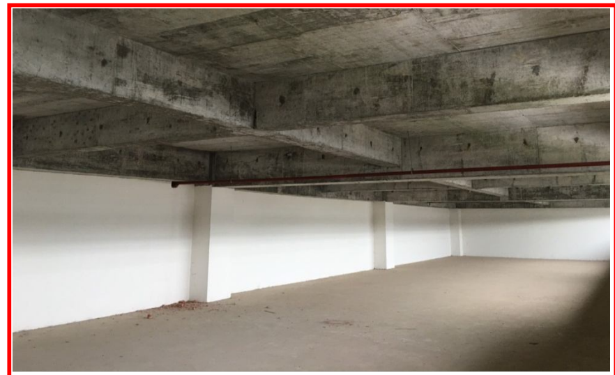
R1&R2 Mezzanine Floor