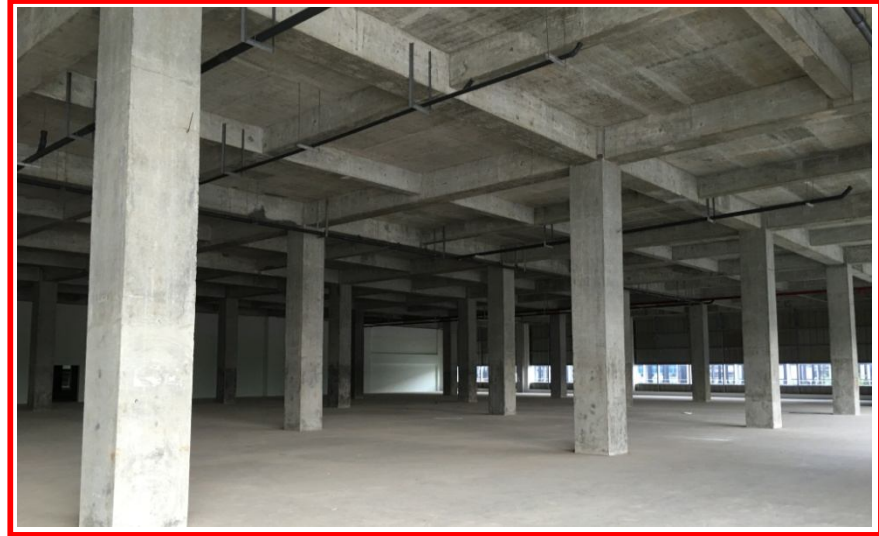
R1 - 1F