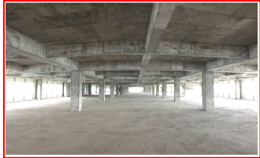
R4 – 3F