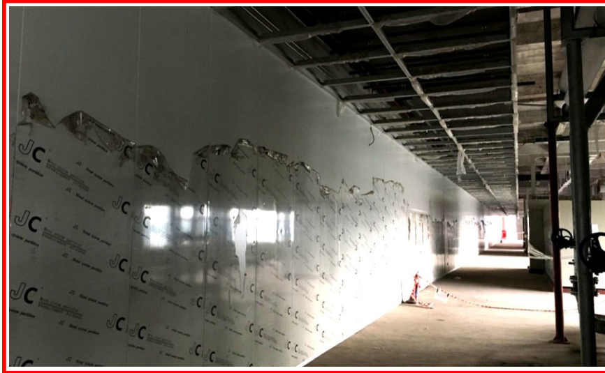
R1 - 2F