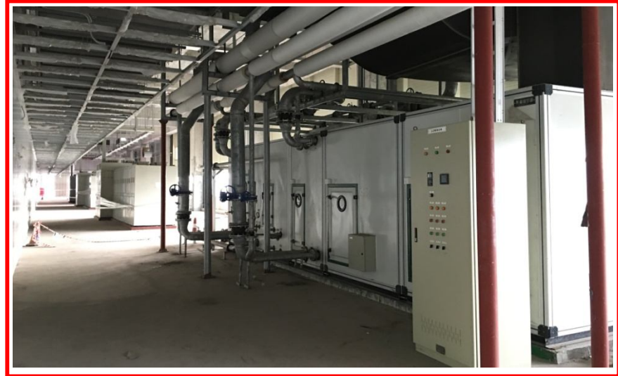
R1 - 2F