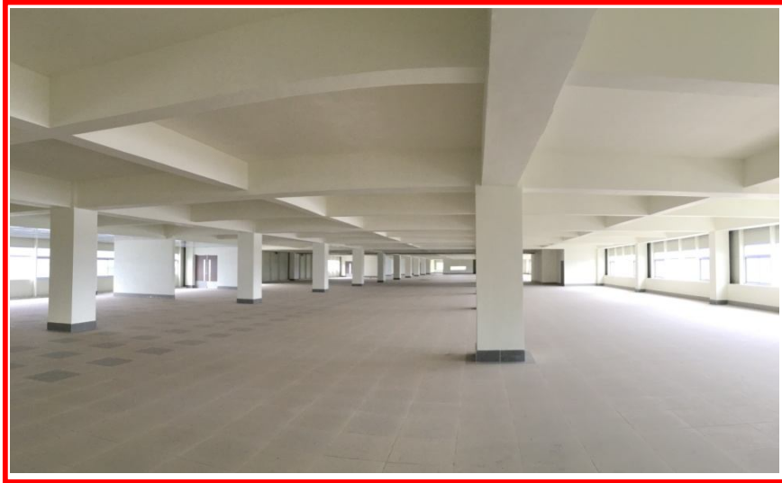
R4 – 2F